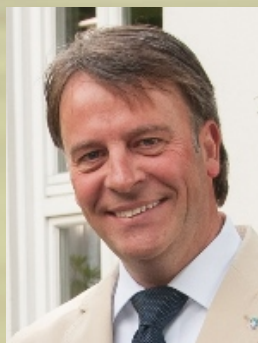
Wahl des neuen Landesinnungsmeisters