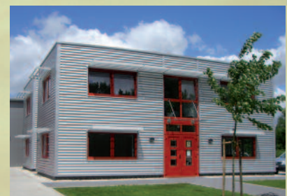
Herzlich willkommen! Neuer Kunde der Reinders Gebäudereinigung ist Duo Collection!