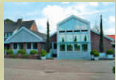
Herzlich willkommen! Neuer Kunde der Reinders Gebäudereinigung ist Neumann Pflanzen