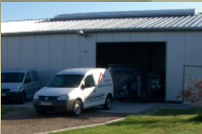
Einzug in neue Lagerhalle