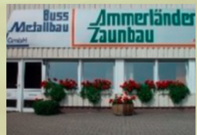
Herzlich willkommen! Neuer Kunde der Reinders Gebäudereinigung ist die Ammerländer Zaunbau GmbH