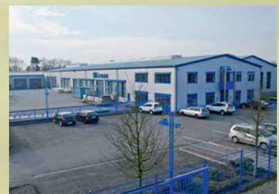
Klarmann Edelstahlverarbeitung GmbH