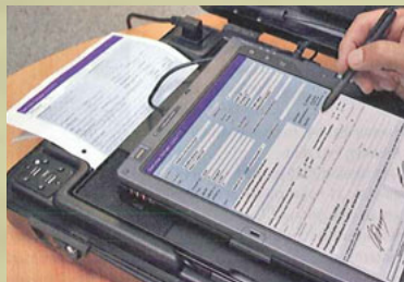
Zettelwirtschaft war gestern