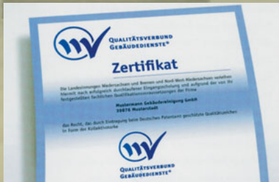
Der Qualitätsverbund Gebäudedienste®