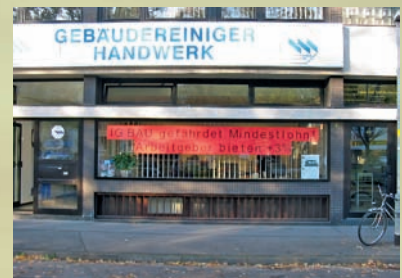
Neuer Lohn- und Mindestlohn-Tarifvertrag