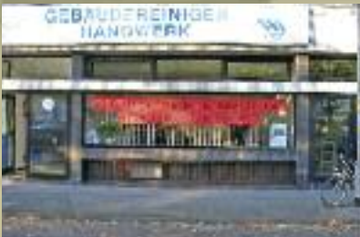
Mindestlohn-Verbindlichkeit statt Lohndumping